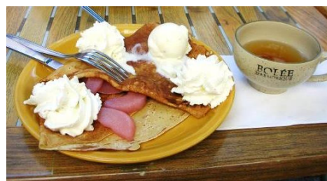
クレープとシードル (リンゴのお酒)

オムレツ (omelette)、グラタン (gratin) カフェ・オ・レ (café au lait)、グルメ (gourmet) クレープ (crêpe)、マヨネーズ (mayonnaise) シェフ (chef)、レストラン (restaurant) アンケート (enquête)、アンコール (encore) クーデタ (coup d'État)、コンクール (concours) グラン・プリ (grand-prix)、デビュー (début)