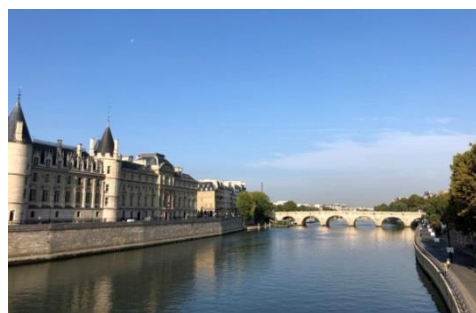
パリの中心部を流れるセーヌ川

外国語を学習するということは、言語だけでなく、異なる文化や考え方を身につけるということです。私たちは言語によって思考し、世界を認識していますから、外国語を習得すれば、ある対象について母国語による思考とは異なる見方ができるようになります。ぜひ大学で英語以外の外国語を学習して複眼的視点を養い、柔軟な発想ができる社会人になってください！