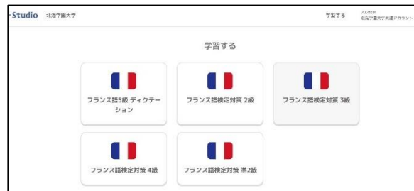
仏検対策オンライン教材トップ画面

検定試験の合格には対策問題集を使った勉強が欠かせません。6号館3階CALL教室で『 仏検公式ガイドブック 』の貸出を行っていますので、付属CDを教室のパソコンで聴きながら効果的に学習することができます。また、 仏検対策オンライン教材 もあります。こちらはネット環境があれば自宅からでも利用できます。